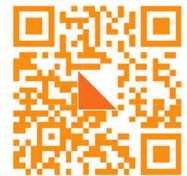
Ville sur Saulx

site internet de l'évènement : https://hugopiszczorowicz2.wixsite.com/4-jours-de-la-meuse