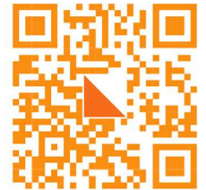
Ville sur Saulx

site internet de l'évènement : https://hugopiszczorowicz2.wixsite.com/4-jours-de-la-meuse