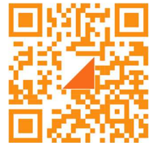
Ville sur Saulx

site internet de l'évènement : https://hugopiszczorowicz2.wixsite.com/4-jours-de-la-meuse